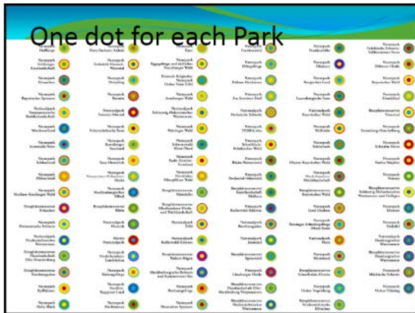
Figuur 3 Het gebruik van kleurenstippen in het Duitse Nationale Parkensysteem, om de eenheid alsmede de verscheidenheid te benadrukken.