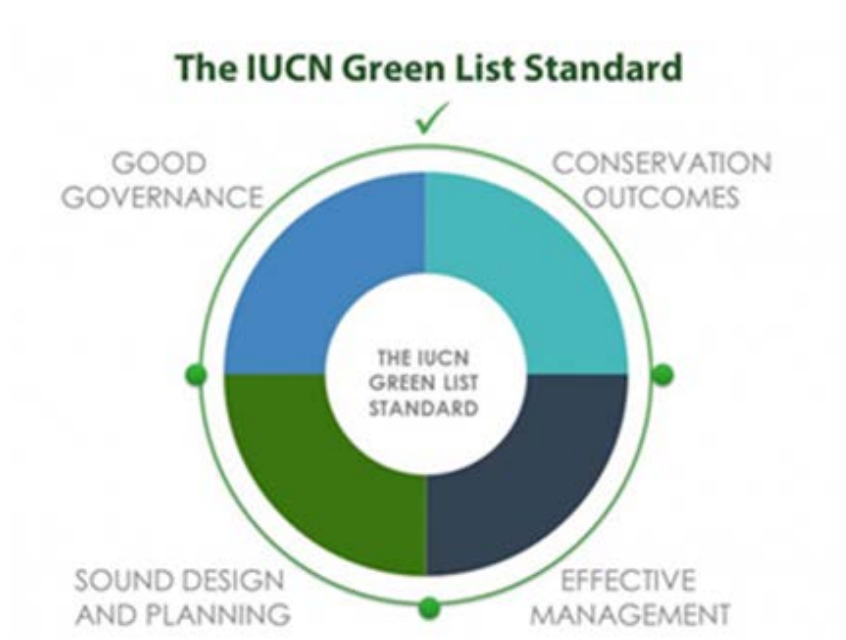
Figuur 1 De vier velden van de IUCN Groene-lijststandaard.

De Groene-lijststandaard is overigens niet bedoeld om zo veel criteria op te voeren en daarmee de eisen te verhogen om beschermd gebied of nationaal park te kunnen worden, maar vooral om handvatten te bieden voor gebieden die een kwaliteitsslag willen maken op velerlei gebied. Het gaat er dus vooral om dat een standaard een lonkend ontwikkelingsperspectief biedt. Natuurlijk kan het verkrijgen van een wettelijke status de gebieden zelf helpen. De criteria zijn niet bedoeld om verder door te selecteren. In het laatste geval zouden discussies kunnen ontstaan over in- en uitsluiting: wie hoort er wel en niet bij? Deze vraag blijft in deze quickscan buiten beschouwing.