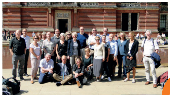
Deelnemers studiereis Thames Landscape.