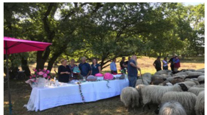
Lunch tussen de schapen.