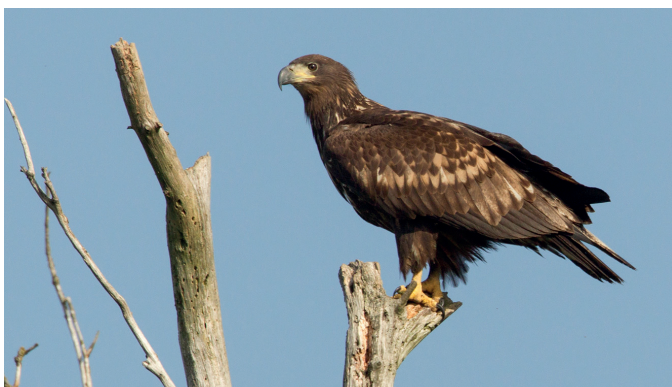
De zeearend, één van onze toppers.

In de leernetwerkbijeenkomst ruimtelijke kwaliteit in het Nationale Beek- en Esdorpenlandschap Drent-