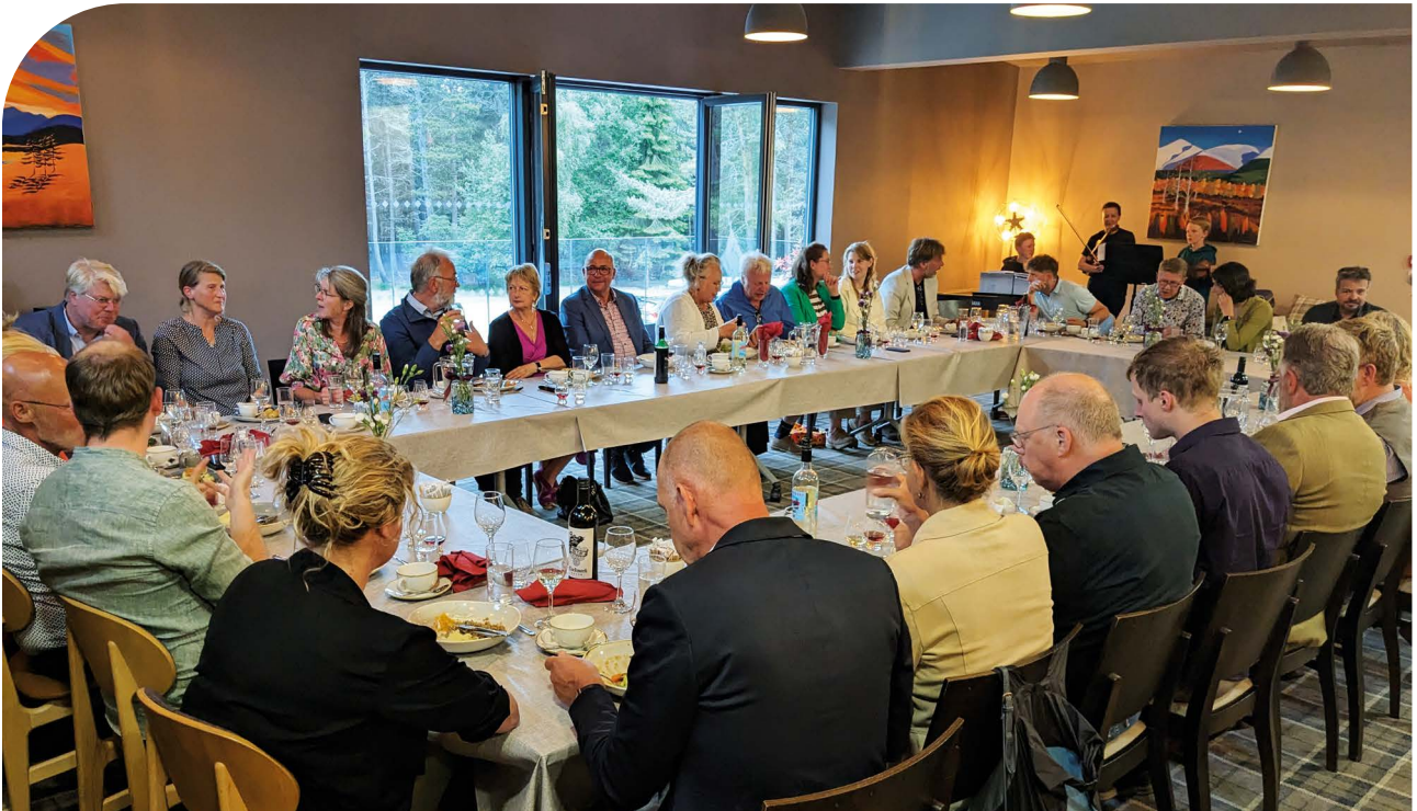
Speyside Heather Centre

Om ook te laten zien wat er in onze nationale parken zoals gebeurt, werd door een aantal Nederlandse parken initiatieven getoond, zoals de Heuvelrugtuinen (Utrechtse Heuvelrug), de koppeling tussen natuur en cultureel erfgoed tot samenhangend landschap (Drentsche Aa). Het e-bikeplan in het kader van duurzaam toerisme (Weerribben Wieden) en bezoekersmanagement door gerichte en betere zonering (Veluwezoom).