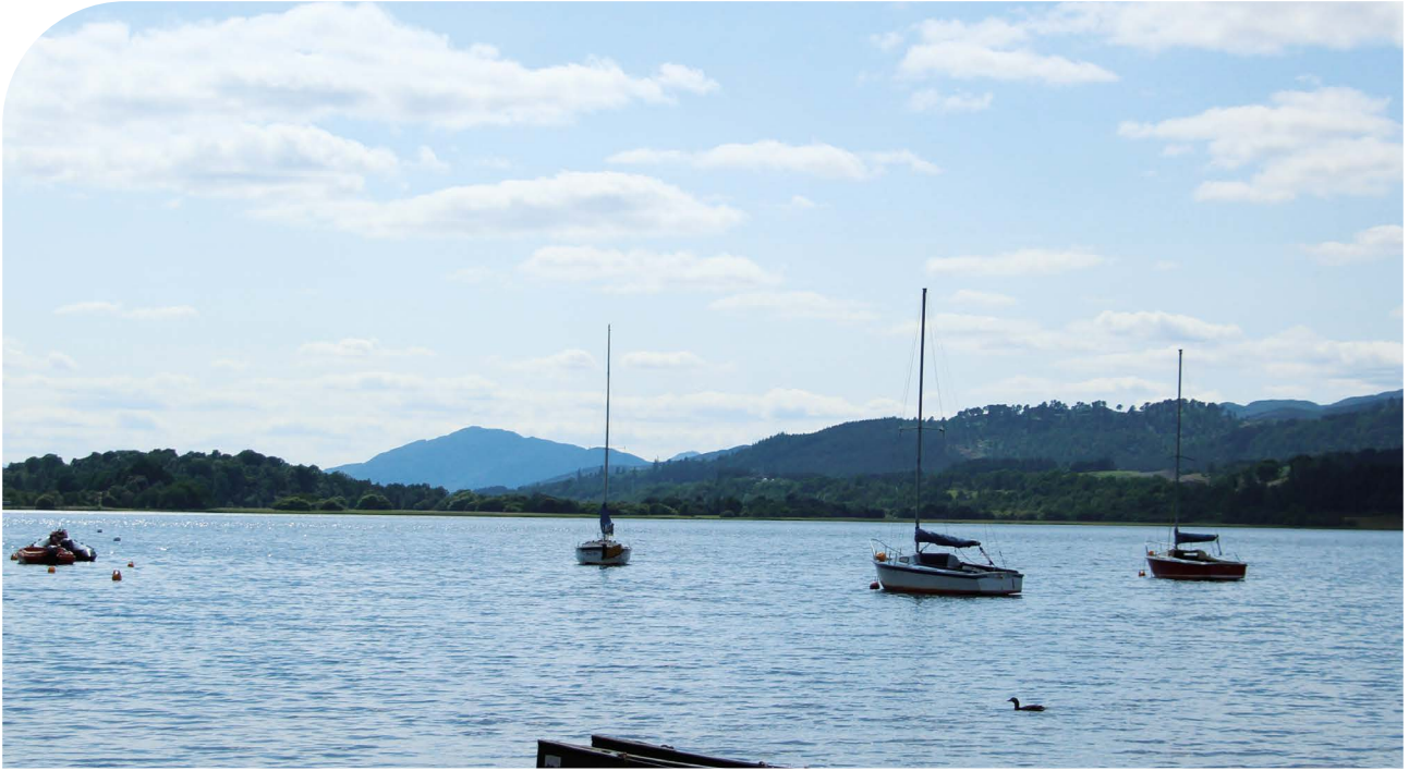
Loch Insch

Daarna bezochten we het Loch Insch Outdoor Centre, waar een mooie samenwerking te zien was tussen ondernemer en park. Met passie voor zijn vak, maar ook voor de natuur, heeft de ondernemer een bloeiend bedrijf weten te realiseren waar mensen graag komen voor watersport in dit mooie natuurgebied.