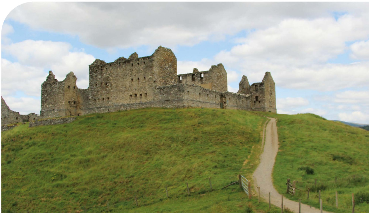
Ruthven Barracks, Speyside Way

Vervolgens bezochten we Ruthven Barracks en de Speyside Way. Voor dit deel van het gebied wordt aandacht besteed aan het realiseren van (lange afstands) routes en bezoekersmanagement, zoals voldoende voorzieningen onderweg.