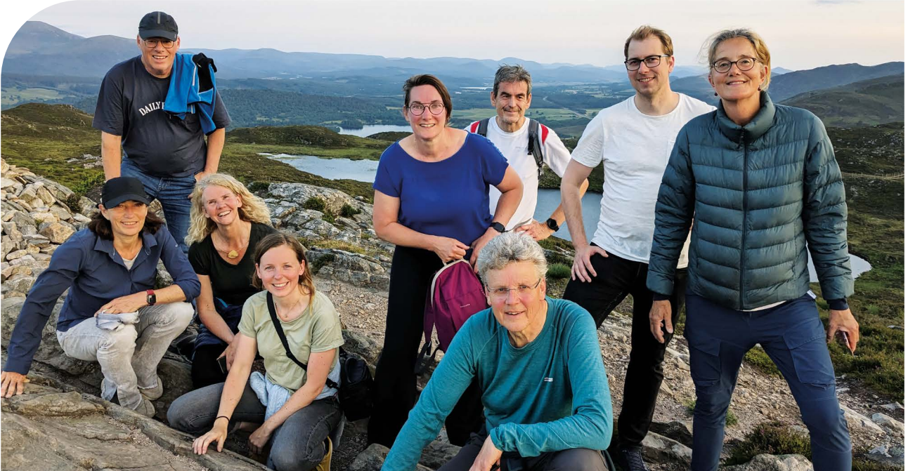
Deel reisgezelschap in Craigellachie National Nature Reserve

Na het diner was er voor belangstellenden gelegenheid te genieten van de zonsondergang bij Loch Morlich. Anderen namen deel aan een wandeling in het Craigellachie National Nature Reserve.