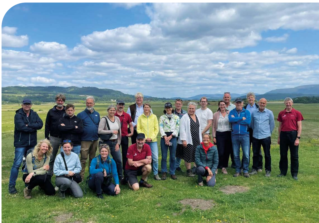
(deel) Groep bij Ruthven Barracks