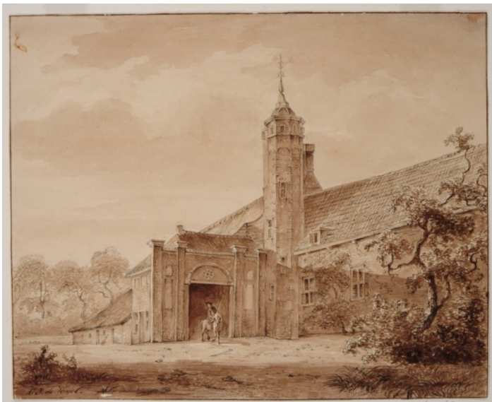
Afb. 03 Dordwijk

https://www.zeeuwseankers.nl/verhaal/zoutzieden