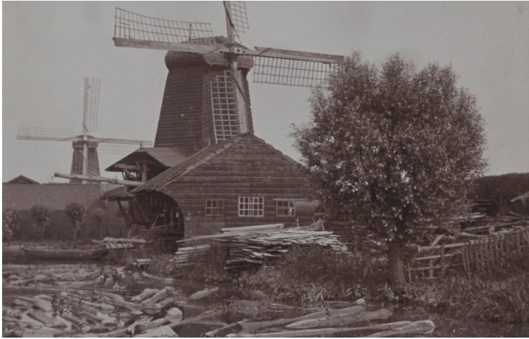
Afb 11 Houtzaagmolens