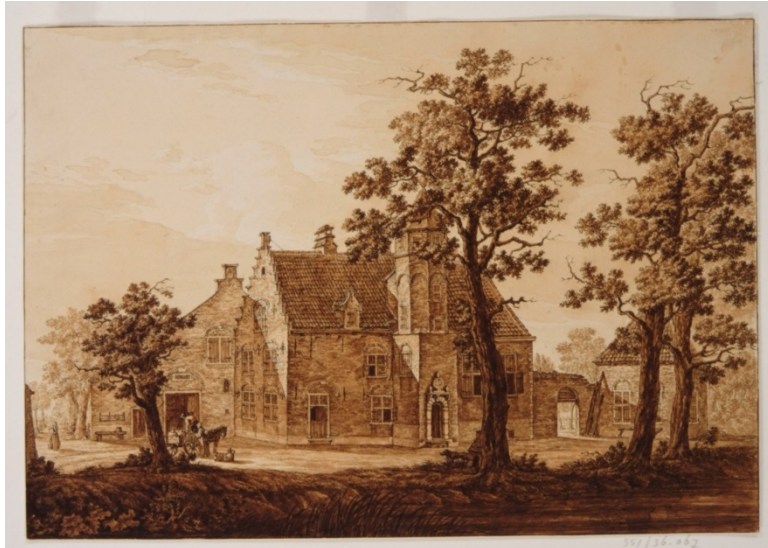
Afb. 04 Crabbehoff

Tekening, J. van Lexmond, Crabbehoff anno 1790. De voormalige buitenplaats en hofstede Crabbehoff in de Zuidpolder aan de Oudendijk.