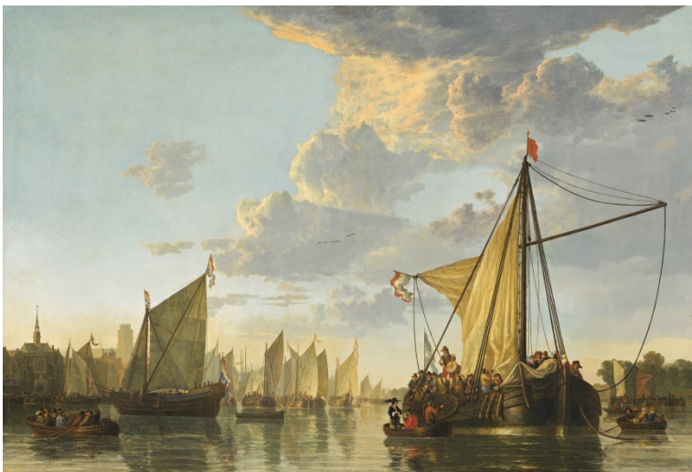
Afb. 08 Aelbert Cuyp

Aelbert Cuyp, Gezicht op Dordrecht, 1655, het schilderij bevindt zich in Engeland, het bestand is verkregen via Wikimedia.