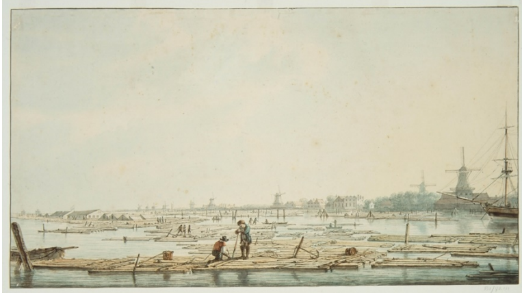
Afb. 13 Abraham van Strij

Abraham van Strij, 1810, 'het slopen van uit het Rijnland afkomstige houtvloten op het Wantij met op de achtergrond de zaagmolens aan de Noordendijk, Collectie Dordracum Illustratum, via Gemeente Archief Dordrecht (GAD).