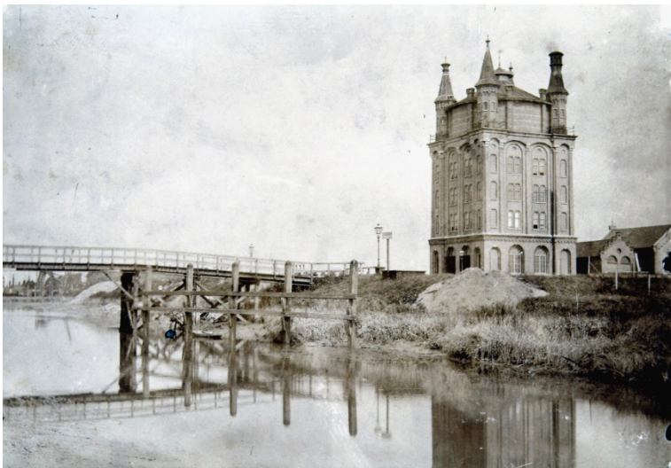
Afb. 10 Watertoren

Riviergezicht met schepen voor Dordrecht, Aert Schouman.