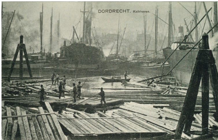
Afb. 12 Houthaven, 1900.