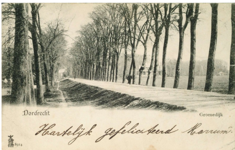
Afb. 06 Groenedijk