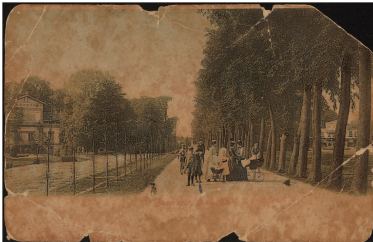
Afb. 05 Groenedijk

Tekening, J. van Lexmond, Crabbehoff anno 1790. De voormalige buitenplaats en hofstede Crabbehoff in de Zuidpolder aan de Oudendijk.