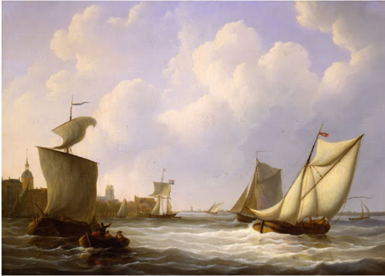
Afb. 09 Aert Schouman

Riviergezicht met schepen voor Dordrecht, Aert Schouman.