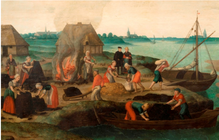
Afbeelding 02. Zoutwinning

Detail van een schilderij (uit circa 1540) waarop de verschillende stadia van het darinc- delven of zoutzieden in beeld zijn gebracht, collectie Stadhuismuseum Zierikzee.