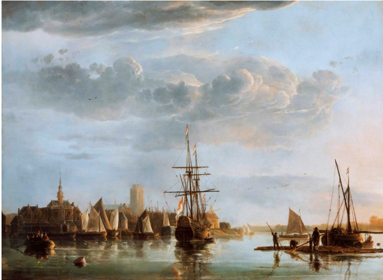
Afb. 07 Aelbert Cuyp

Aelbert Cuyp, Gezicht op Dordrecht, 1655, het schilderij bevindt zich in Engeland, het bestand is verkregen via Wikimedia.